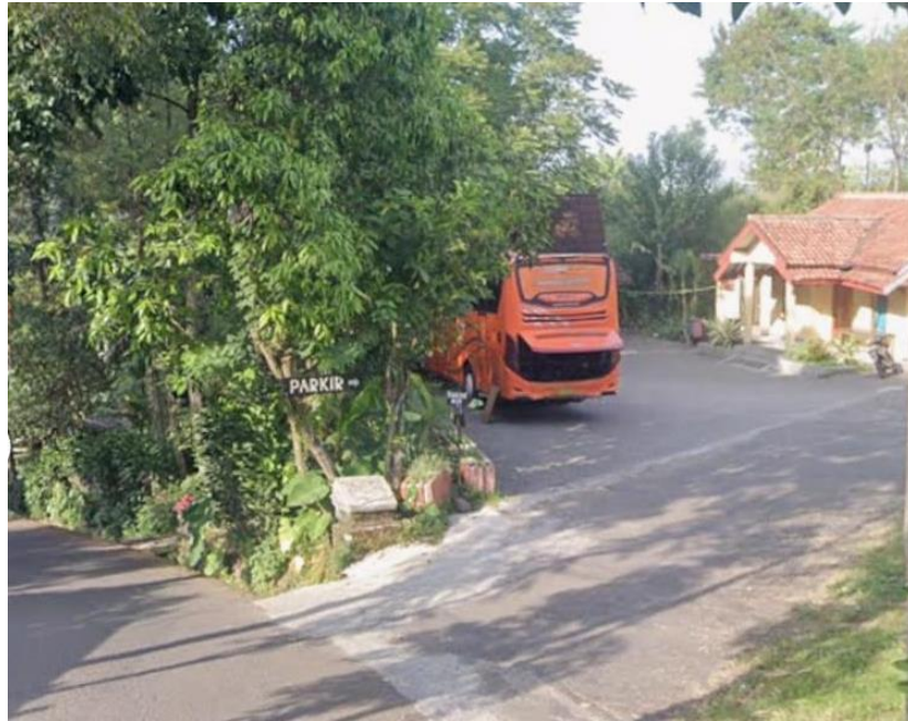
Gambar 7.3.Lahan Parkir dan Halaman Kantor RW 10

Lahan parkir yang letaknya berada di atas, berjarak sekitar 300 meter dari Bale Sarasehan dan Imah Panggung. Lahan parkir terlihat terbatas. Lahan parkir yang lain letaknya lebih di atas lagi yang jaraknya lebih jauh dengan kondisi jalan menanjak ke atas.