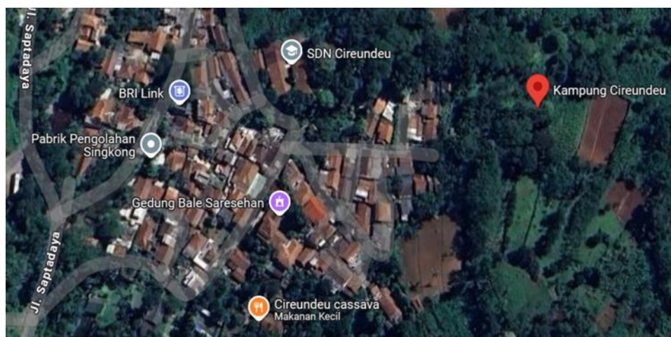
gambar 3.2 Peta Kampung Cireundeu 1

Pola permukiman warga Kampung Cireundeu RW 10 memiliki tata letak rumah yang padat, untuk memberikan gambaran yang lebih komprehensif tentang Kampung Cireundeu, berikut adalah peta wilayah kampung ini beserta penjelasan rinci mengenai akses dan tata letak pemukiman di Kampung Cireundeu.