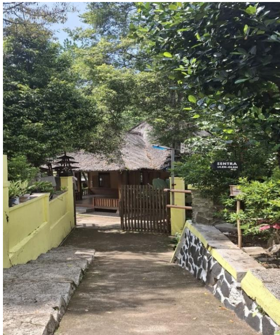
Gambar 7.1 Imah Panggung dari Bale Sarasehan

Pembangunan prasarana parkir representative bersamaan dengan pembangunan gedung fisik serba guna yang mudah terjangkau pengunjung bagi terselenggaranya pertunjukan dan latihan murid-murid sekolah luar. Pihak-pihak terkait yang perlu terlibat adalah Disbudparpora Kota Cimahi, Dinas Pekerjaan Umum dan Penataan Ruang, dan BPKAD Kota Cimahi.