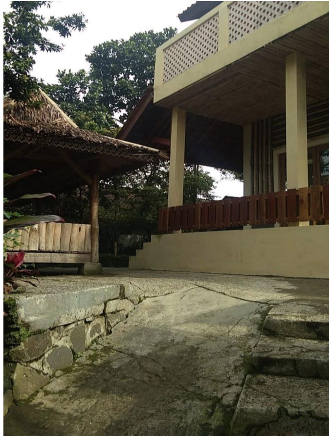
Gambar 7.2. Bale Sarasehan dan Jalan Setapak Menuju Imah Panggung

Gambar 7.2. memperlihatkan gedung Bale Sarasehan yang biasa diperuntukan pertunjukan kesenian tradisional. Terlihat pula anak tangga dan jalan bersemen menuju ke Imah Panggung (Gambar 7.1.). Orang berjalan kaki menuju Imah Panggung dari Bale Sarasehan.